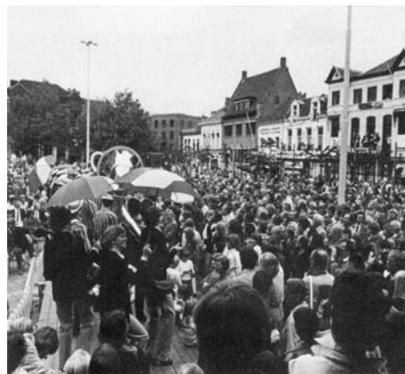
"On stad vol muzik" Eindhoven 1981